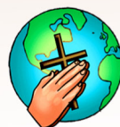
World Mission Sunday

Świętemu Józefowi powierzamy nasze rodziny i naszą Trójcowską wspólnotę.