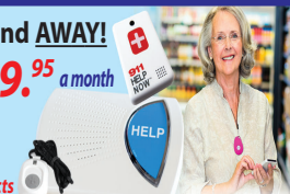
This Button SAVES Lives! As Shown GPS, Lowest Price Guaranteed!