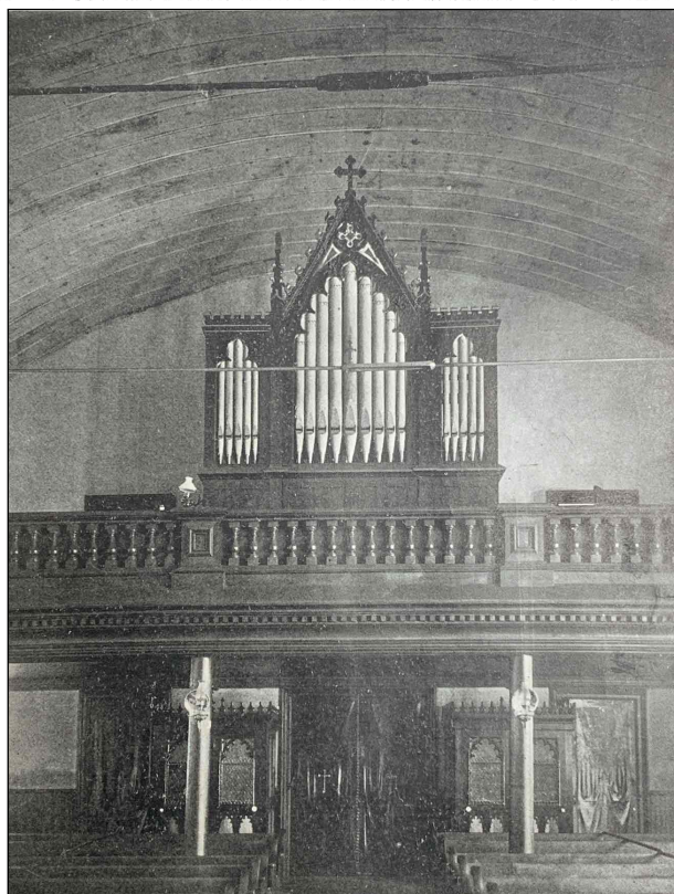
Organy w kościele Świętej Trójcy